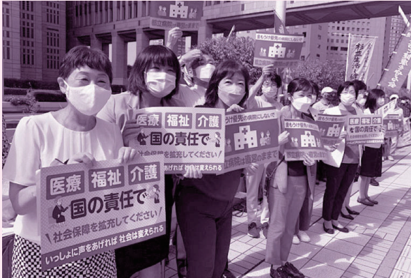
都庁前の行動に参加する都議団

都立・公社病院は感染症、災害、難病、小児、周産期、救急、障害者、島しょ医療など不採算ではあっても都民の命と健康を守るためにはなくてはならないものです。独法化で経営効率優先にさ